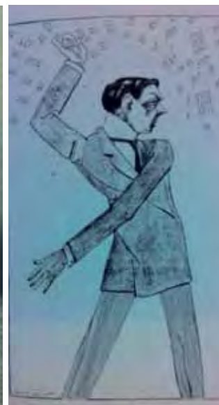
Corrado Gini e la caricatura fatta nel 1914 da Primo Sinopico.

nava l'ISTAT, e rimase presidente sino alle sue dimissioni nel 1932, dovute ad incomprensioni con Mussolini.